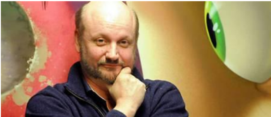
El director de "El secreto de sus ojos", Juan José Campanella.